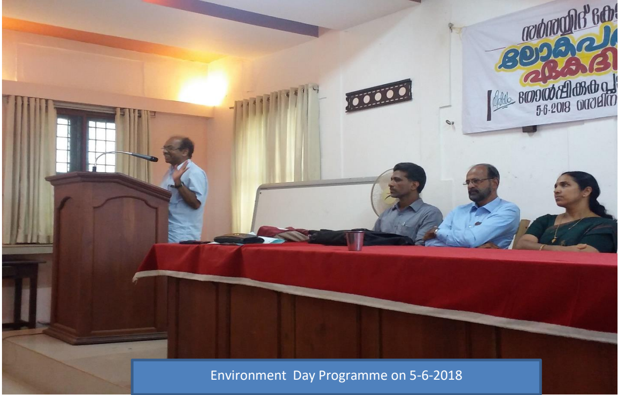
Environment Day Programme on 5-6-2018