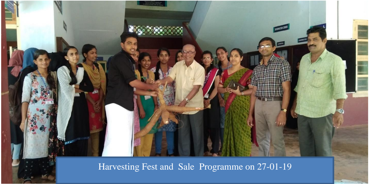
Harvesting Fest and Sale Programme on 27-01-19