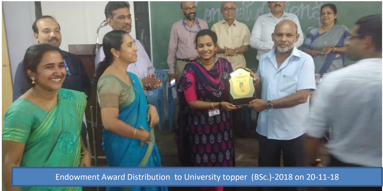
Endowment Award Distribution to University topper (BSc.)-2018 on 20-11-18