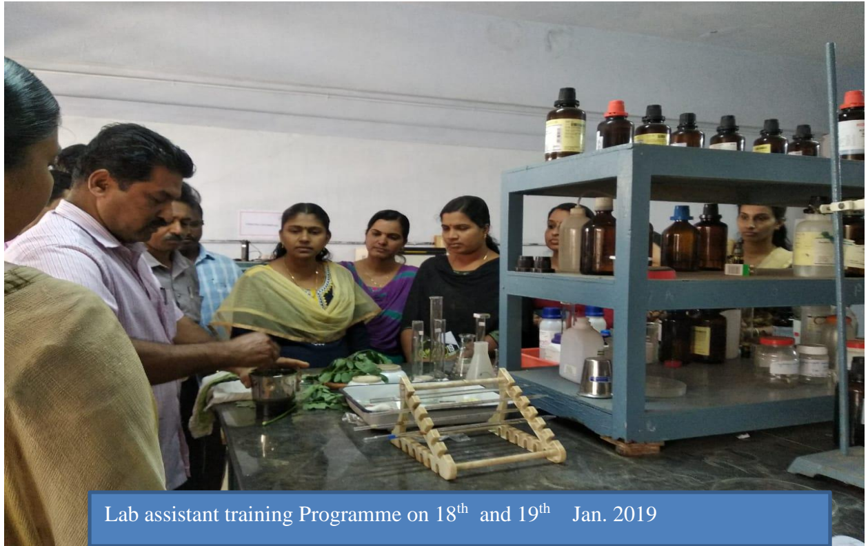
Lab assistant training Programme on 18 th and 19 th Jan. 2019