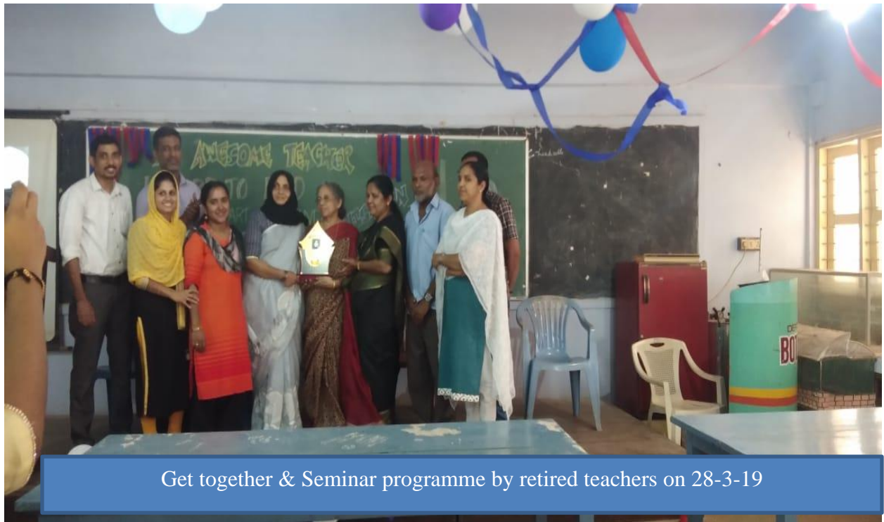
Get together & Seminar programme by retired teachers on 28-3-19