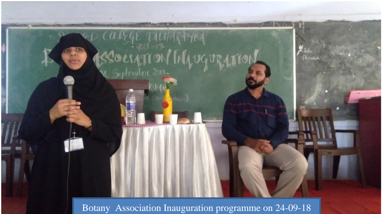
Botany Association Inauguration programme on 24-09-18