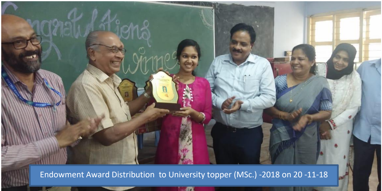
Endowment Award Distribution to University topper (MSc.) -2018 on 20 -11-18